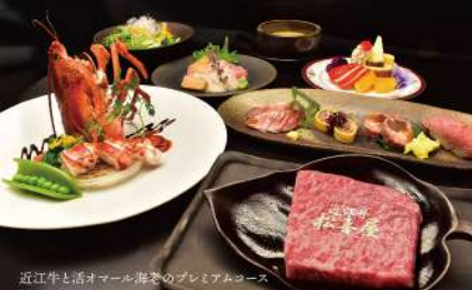
近江牛と活オマール海老のプレミアムコース