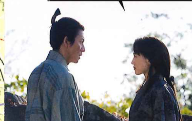
二人の心が、夫婦として同志として通じ合う